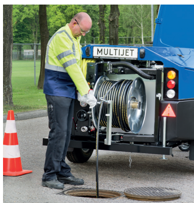
800 liter water aan boord

De zwenkbare haspel zwenkt eerst tot 90° uit de achterkant van de machine. De haspel zelf kan dan nog eens 180° gedraaid worden voor een optimaal werkcomfort onder alle omstandigheden. De haspels worden afgeschermd door de kap van de machine, wat de levensduur van de machine beslist ten goede komt. Het nieuwe model hogedruk slang van de MultiJet is niet alleen de lichtste slang in zijn soort, maar kent ook een minimaal drukverlies dankzij het gladde binnenoppervlak en de grotere binnendiameter. De effectieve opbrengst van de MultiJet is hiermee verder verhoogd, waardoor de spuitkop een hogere werkdruk levert. Uiteraard kan de MultiJet met afstandsbediening worden uitgerust voor optimaal bedieningsgemak door één persoon. Ook een optie voor oliespoorreiniging behoort tot de mogelijkheden.